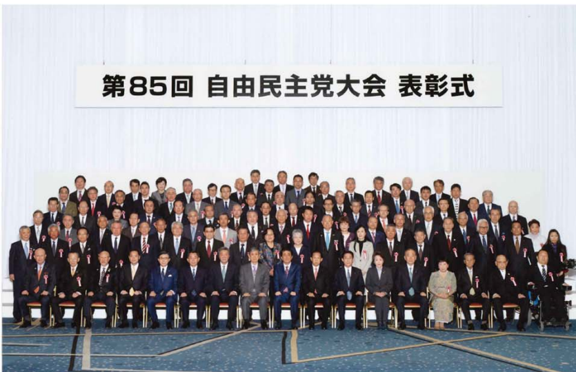
平成30年3月25日 第85回自由民主党大会特別表彰記念 於 グランドプリンスホテル新高輪